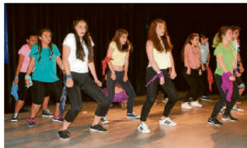
Actuación del grupo de Danza. El grupo de Danza de la Escuela de Música de Santa Marta de Tormes ha ofrecido una actuación en el auditorio Enrique de Sena en el que han mostrado al público lo aprendido durante el pasado curso escolar. | EÑE