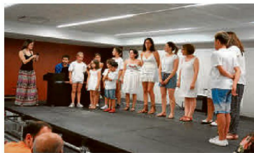
Concierto de la Escuela de Música. Los alumnos de la Escuela de Música de Villares de la Reina han cerrado las actividades del curso antes de las vacaciones estivales con un animado concierto en el que han participado sus alumnos en las distintas modalidades. | EÑE