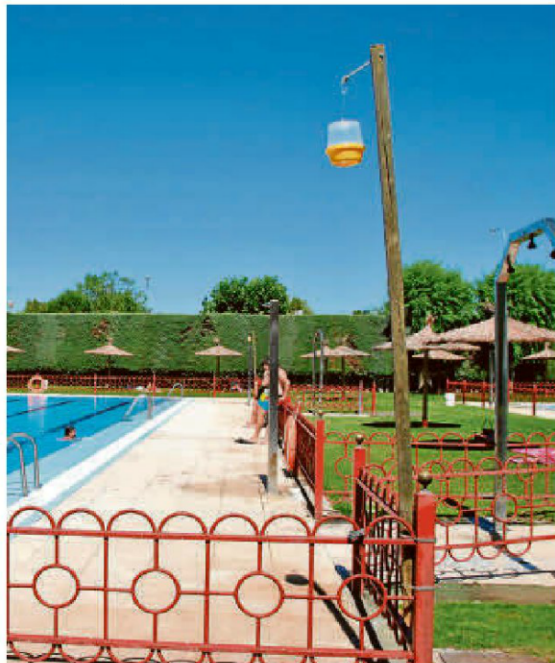
Una de las jaulas trampa para las avispidas en las piscinas municipales.

Un servicio que ha permitido dar tranquilidad a las familias y usuarios que acuden a diario a las piscinas, que pueden disfru-